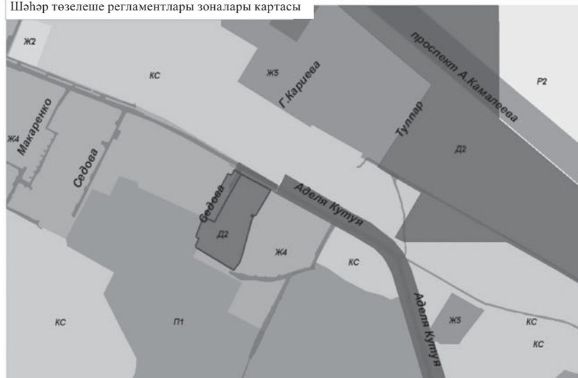
Шәһәр төзелеш регламентлары зоналары картасы