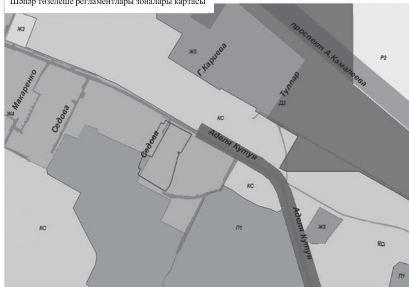
Шәһәр төзелеш регламентлары зоналары картасы